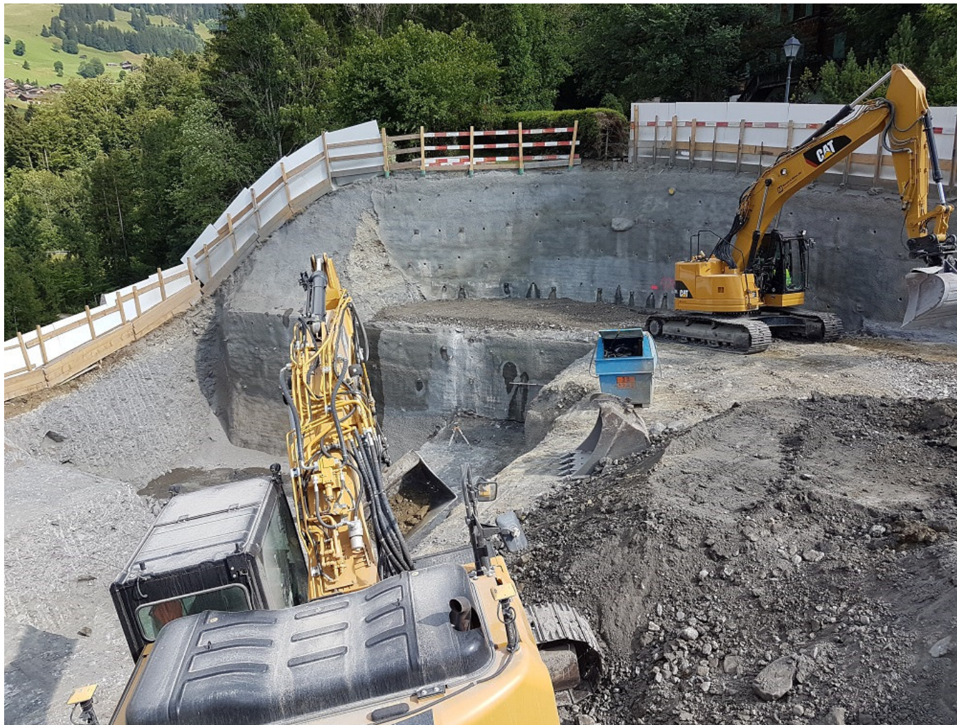
Aushub und Nagelwand

BAUPHYSIK VERMESSUNG SPEZIALTIEFBAU KANALISATIONEN WASSERVERSORGUNG